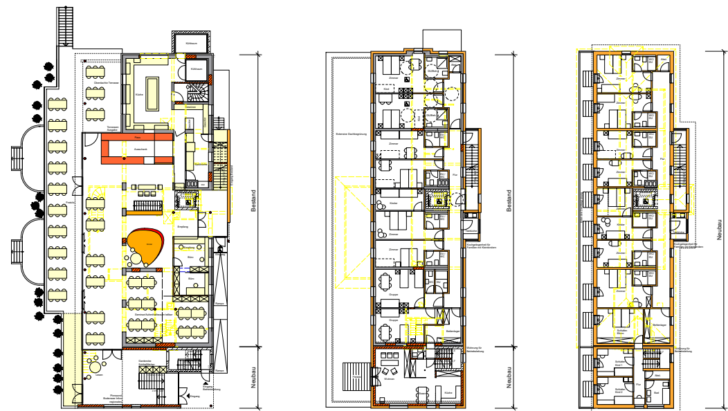
Grundriss EG | M 1_200